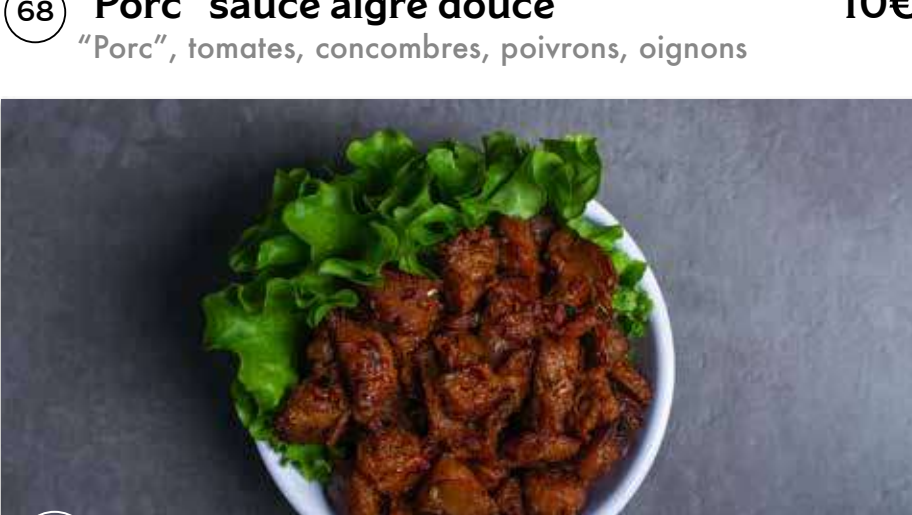
69 "Poulet" à la citronnelle 10€