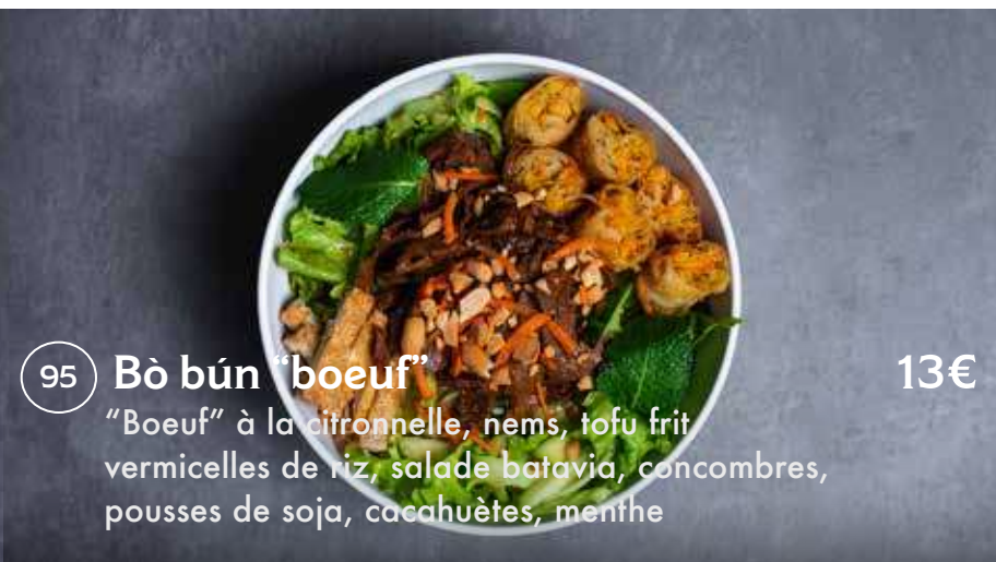
95 Bò bún "boeuf" 13€ "Boeuf" à la citronnelle, nems, tofu frit, vermicelles de riz, salade batavia, concombres, pousses de soja, cacahuètes, menthe