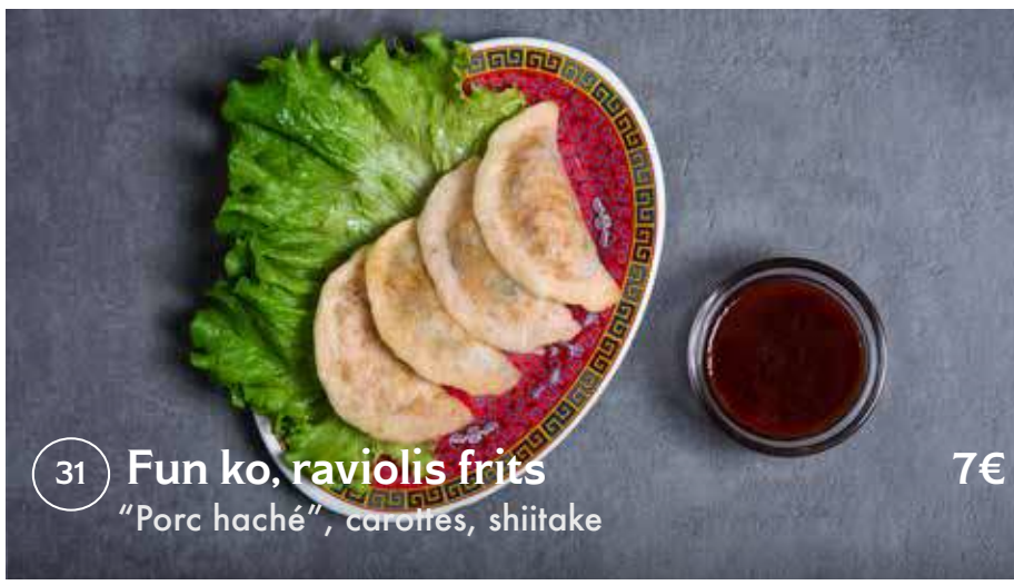
31 Fun ko, raviolis frits 7€ "Porc haché", carottes, shiitake