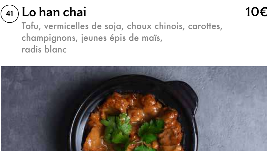
43 Marmite "poulet" caramélisé 10€