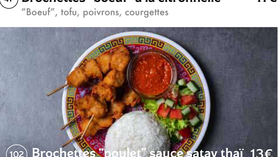
102 Brochettes "poulet" sauce satay thaï 13€ "Poulet", riz, salade batavia, concombres, tomates