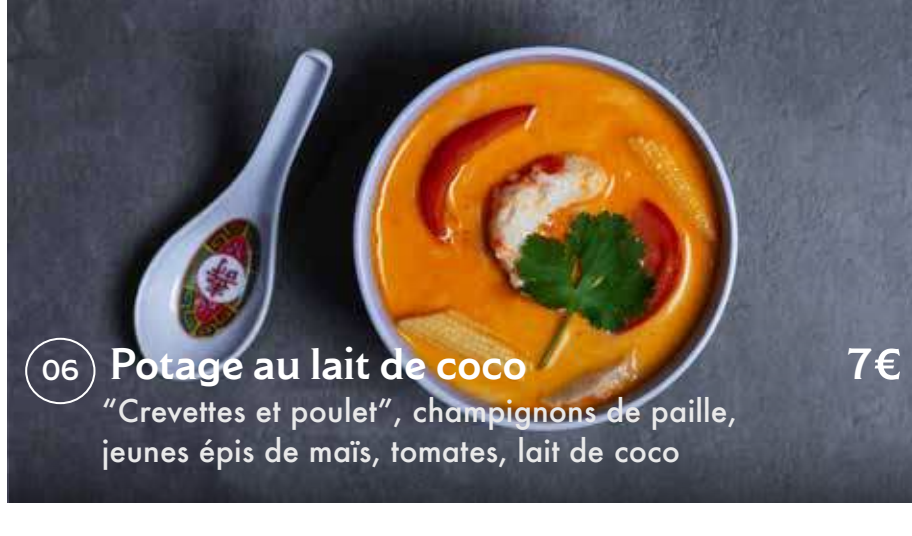
06 Potage au lait de coco 7€ "Crevettes et poulet", champignons de paille, jeunes épis de maïs, tomates, lait de coco